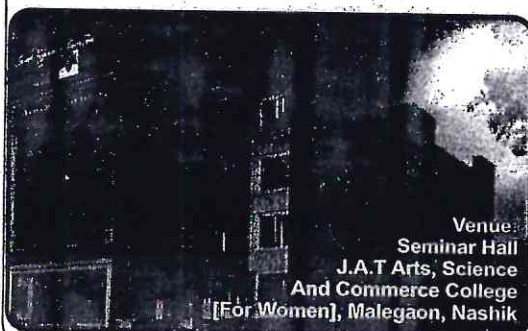
Venue Seminar Hall J.A.T Arts, Science And Commerce College [For Women], Malegaon, Nashik

Affiliated to Savitribai Phule Pune University, Pune-411007